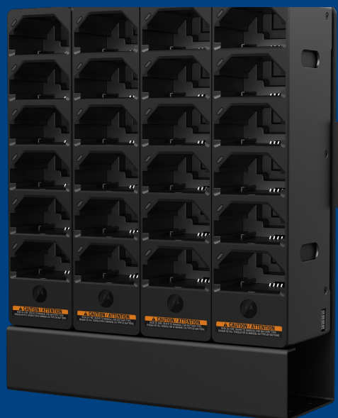
MODUŁOWA ŁADOWARKA TETRA (ZESTAW MONTAŻOWY SPRZEDAWANY ODDZIELNIE)