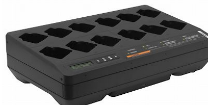
ŁADOWARKA WIELOJEDNOSTKOWA IMPRES 2 – 12 KIESZONKOWA