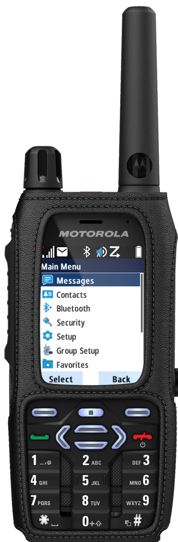
MIĘKKI FUTERAŁ SKÓRZANY (RADIOTELEFON SPRZEDAWANY ODDZIELNIE)

Niezależnie od tego, czy członkowie zespołu chcą nosić radiotelefon na ramieniu, na piersi czy na biodrze, znajdą akcesoria do noszenia dopasowane do ich potrzeb. Do wyboru jest cała gama futerałów skórzanych, pasek, akcesoriów do noszenia na ramieniu i zaczepów na pasek – wszystkie zaprojektowane, aby zapewnić łatwy, ale bezpieczny dostęp do radiotelefonu MXP600, aby zespół miał wolne ręce i możliwość koncentracji na wykonywanym zadaniu.