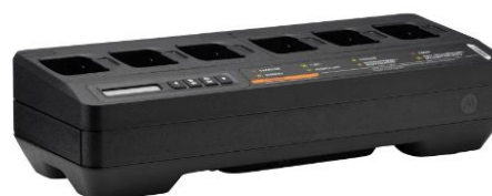
ŁADOWARKA WIELOJEDNOSTKOWA IMPRES 2 – 6 KIESZONKOWA