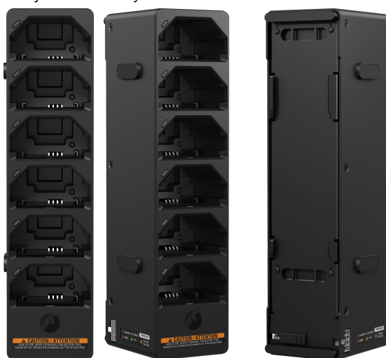
PRZÓD PRZÓD – LEWA STRONA TYŁ – PRAWA STRONA